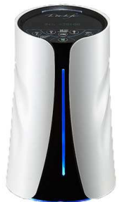
新型 リタライフホワイト

美容、健康に家族のために。今TVでも話題の水素風呂 買うには少し高価と思っている方、3500円/月のレンタルがあります 一度お試されませんか？ もし気に入らなかったら、最低3ヶ月でキャンセルできます 詳しくはお問い合わせください